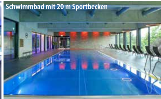
Schwimmbad mit 20 m Sportbecken

Bad Kissingen liegt an der fränkischen Saale, südlich der Rhön im Bundesland Bayern und gehört seit 2021 zum UNESCO-Welterbe „Die bedeutendsten Kurstädte Europas“. Der historische Kurort verkörpert das Phänomen der europäischen Kur auf besondere Art und Weise. Das Bild der Stadt wird vor allem durch die prächtigen Parks und die prunkvollen historischen Bauten geprägt. Hier stechen der Kurpark mit Wandelhalle und Regententbau sowie die Bayerische Spielbank hervor. Besonders sehenswert sind auch das Bismarck-Museum und die historische Altstadt mit Geschäften und typisch fränkischer Gastronomie. Mit dem CUP VITAL Service-Taxi reisen Sie ganz bequem von Zuhause ins Hotel und zurück!