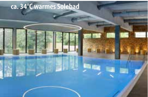
ca. 34°C warmes Solebad

HolidayCheck 99% Weiterempfehlung Parkhotel CUP VITALIS Stand: 08/2023