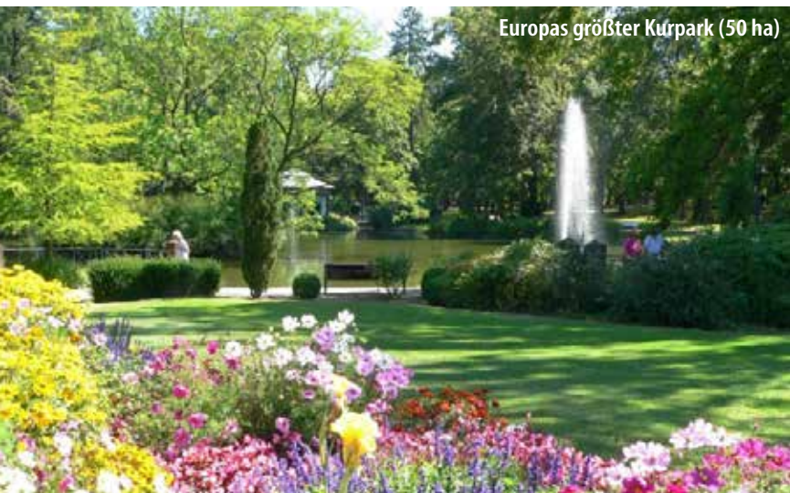
Europas größter Kurpark (50 ha)