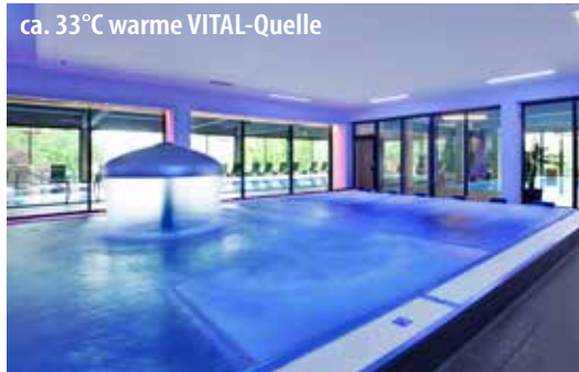
ca. 33°C warme VITAL-Quelle