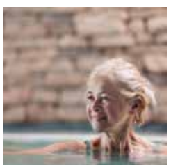
RELAX – Seele baumeln lassen