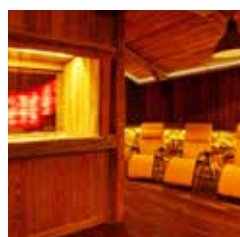
SALZLUFT – Atemwege immunisieren