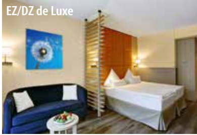
EZ/DZ de Luxe